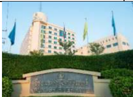
クルンシリ・リバーホテル